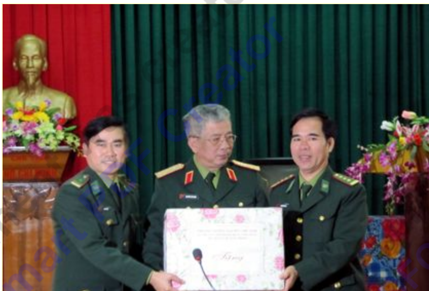
Thượng tướng Nguyễn Chí Vịnh tặng quà, động viên cán bộ, chiến sĩ Đồn Biên phòng Cửa khẩu Quốc tế Cầu Treo

QĐND - Ngày 3 và 4-1, Thượng tướng Nguyễn Chí Vịnh, Ủy viên Trung ương Đảng, Thứ trưởng Bộ Quốc phòng và Đoàn công tác của Bộ Quốc phòng đã làm việc tại Quân khu 4 và Bộ CHQS, Bộ chỉ huy BĐBP tỉnh Hà Tĩnh.