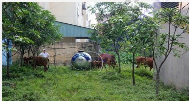
Có thể DN sẽ nghĩ xa hơn khi thuê được mảnh đất vàng ngay thành phố, rồi có thể chuyển đổi mục đích. Nhưng dư luận vẫn hết sức khó hiểu khi lãnh đạo tỉnh Hà Tĩnh lúc bấy giờ lại đồng ý cho xây dựng nhà máy bia ở trong khu đô thị?!