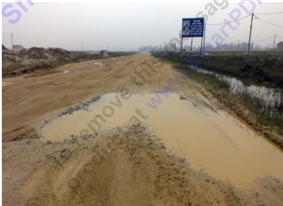
Một cái "ao" giữa đường

Bị tàn phá bởi những đội xe tải trọng lớn phục vụ dự án khai thác mỏ sắt Thạch Khê và những đội xe vận chuyển đá, cát từ phía biển ra, đoạn đường bị "băm nát" thành vô số ổ gà, ổ voi, những "ao" nước chênh ềnh giữa đường. Những đồng đất, cát lớn từ hai khu tái định cư quy hoạch hai bên đoạn đường cũng tràn xuống khiến con đường thêm lầy lội, bụi bặm. Mỗi khi đi qua đoạn đường này, dù nắng hay mưa, người dân đều thấy khôn khổ.