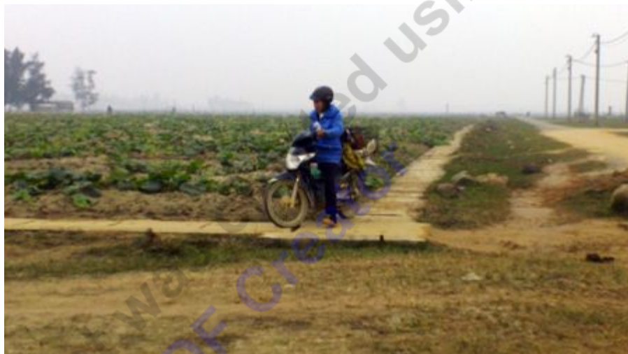
Người dân đi tránh đường khác để khỏi phải qua đoạn đường đau khổ

Để tránh bị tai nạn trên đường, người tham gia giao thông qua đây thường phải dắt xe qua ruộng rồi đi ké qua một khu tái định cư đang xây dựng dở dang. Những con đường nhỏ và cả hệ thống mương thoát nước có nắp đậy rộng chừng 1m của khu tái định cư đã trở thành con đường lưu thông của các phương tiện xe cơ giới. Từ đây xuất hiện nhiều vụ xô xát, cãi vã giữa những người đi đường và người bảo vệ khu tái định cư.