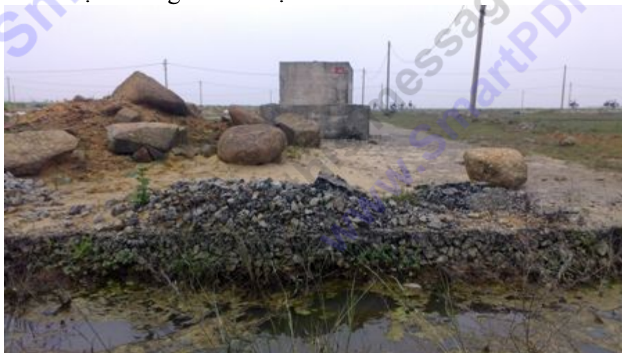
Lo sợ cơ sở hạ tầng hỏng, doanh nghiệp xây dựng khu tái định cư đã cho đào mương ngăn cách với tuyến tỉnh lộ 12

Mới đây, lo sợ người dân đi lại nhiều sẽ khiến hệ thống công trình khu tái định cư hỏng, chủ đầu tư, nhà thầu buộc phải đào mương, đổ đất đá chia cắt các điểm đầu nổi tự phát từ tỉnh lộ 12 sang khu tái định cư.