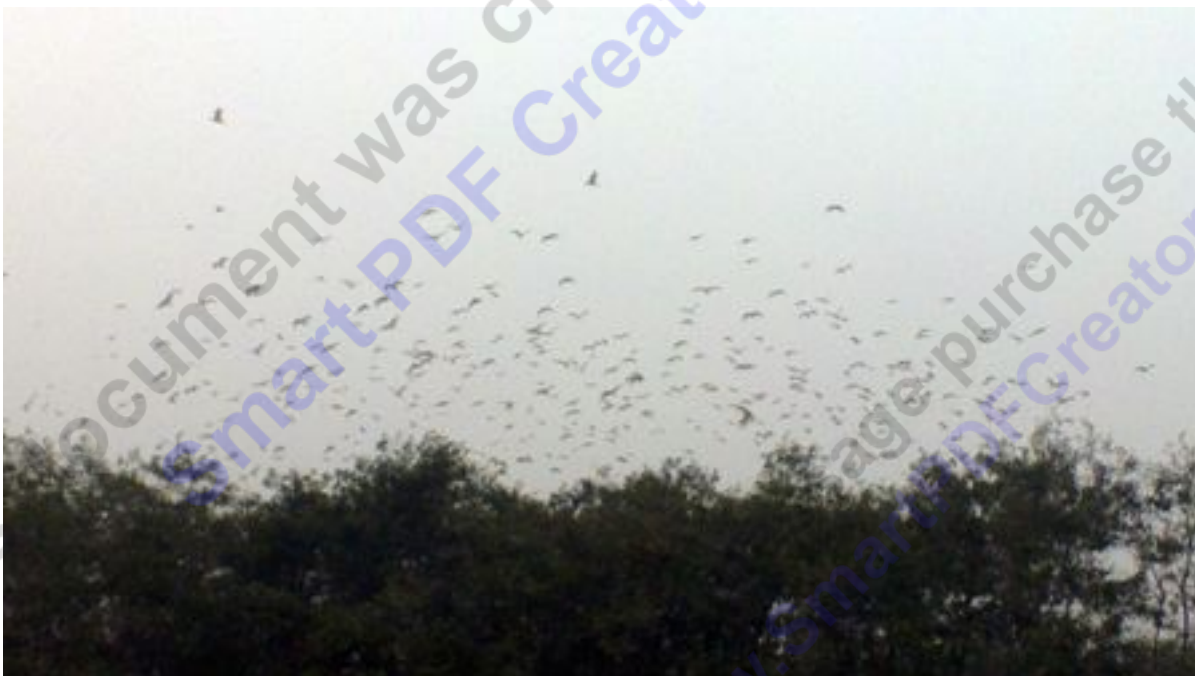
Đàn chim hàng ngàn con đậu kín hai đảo nhân tạo tại khu sinh thái

Chiều 16/1, có mặt tại khu sinh thái nằm ở phía bắc TP Hà Tĩnh, PV Dân trí đã ghi lại được vô số hình ảnh về đàn cò đông nghịt chưa từng thấy xuất hiện ở TP này.