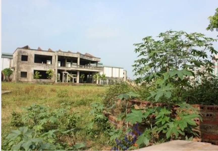
Gần 30.000m 2 đất mặt tiền QL1A, trong lòng thành phố để hoang hoá cho cỏ mọc từ 4-5 năm nay.