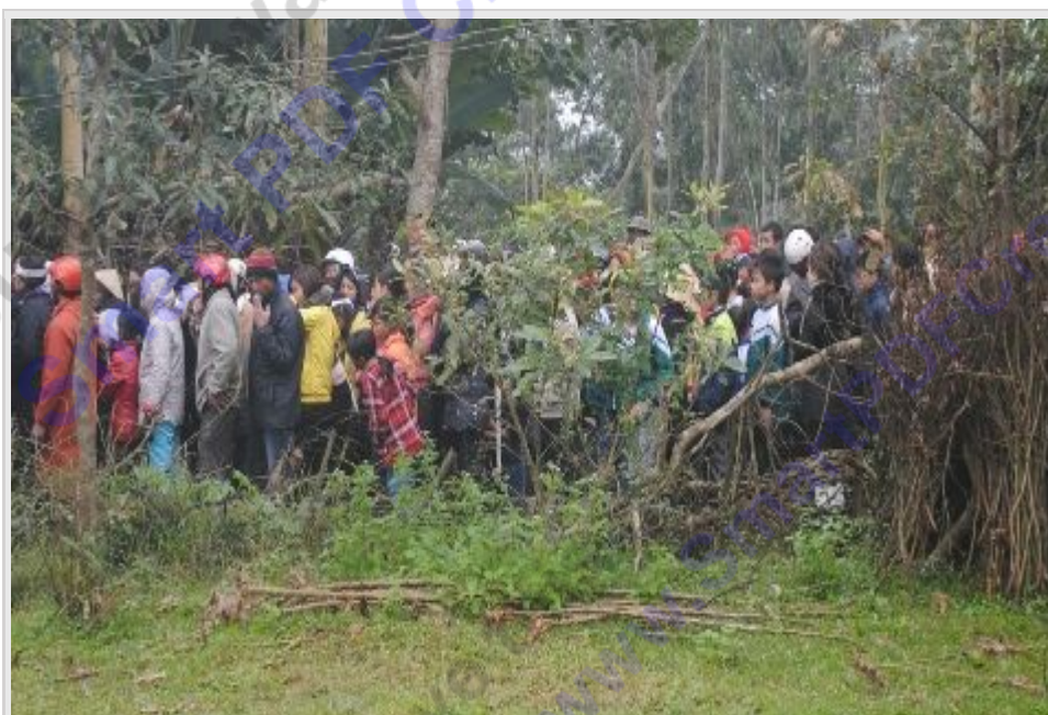
Khu vực đập Trống nơi phát hiện xác nạn nhân

hiều ngày 9/1 Công an xã Phú Lộc, huyện Can Lộc cho biết, khoảng 17h30 ngày 8/1 người dân sống gần khu vực đập Trống, xã Phú Lộc đã phát hiện xác một người đàn ông bị chém nhiều nhất, nằm chết bên vũng máu.