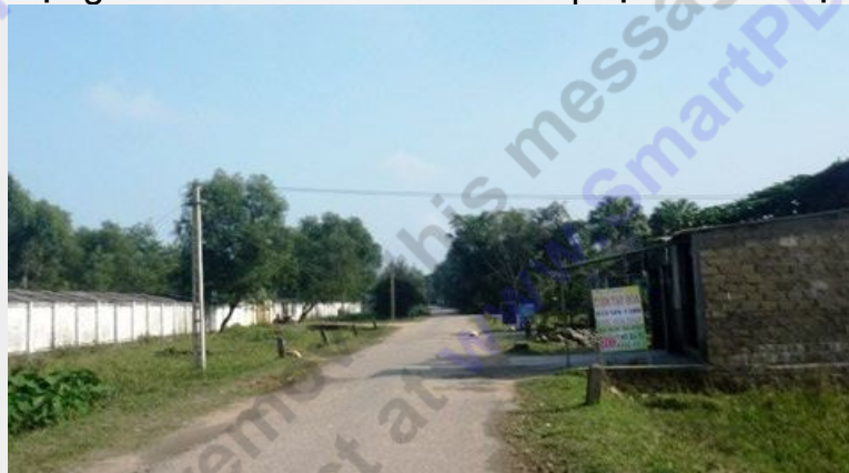
Khu vực trước công trường THPT Nguyễn Đình Liễn, nơi L. bị nhóm nữ sinh đánh dã man.

Rồi bỗng dưng 3 năm nay không có tin tức gì về mẹ nữa. Bà ngoại thì ngày càng già yếu nên dì dượng đã đưa cháu về nuôi để tiếp tục cho ăn học.