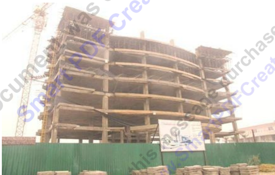
Tòa nhà xây dựng dở dang, chủ đầu tư nợ tiền xây dựng cơ bản hàng tỷ đồng.

Nợ đọng trong xây dựng cơ bản (XDCB) trên địa bàn tỉnh Hà Tĩnh đã vượt qua con số 1.300 tỷ đồng, để lại nhiều hệ lụy. Trong năm 2013, Hà Tĩnh quyết định không khởi công thêm công trình mới nào để có ngân sách và phân đấu hoàn thành việc xử lý nợ đọng XDCB trước năm 2015 theo đúng tinh thần Chỉ thị 27/CT-TTg của Thủ tướng Chính phủ.