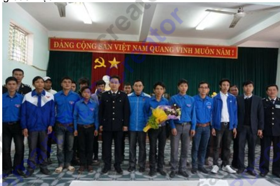
Lễ ra quân.

(HQ Online)- Ngày 7-1-2013 tại Khu kinh tế cửa khẩu Cầu Treo (Hương Sơn - Hà Tĩnh), Cục Hải quan Hà Tĩnh phối hợp với Tỉnh đoàn Hà Tĩnh tổ chức Lễ ra quân chiến dịch tuyên truyền vận động quần chúng nhân dân trong đợt cao điểm phòng chống buôn lậu.