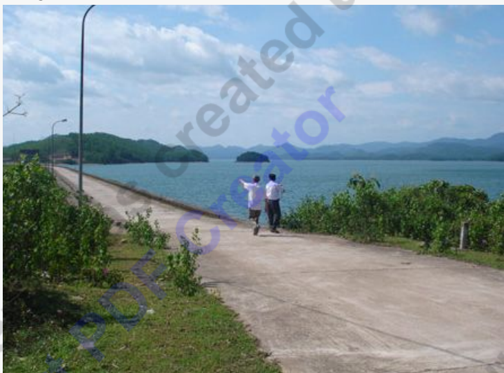
Toàn cảnh hồ Kẻ Gỗ

Xahoi - Nói đến công trình thủy lợi vừa đẹp vừa mang lại hiệu quả thiết thực cho lợi ích dân sinh thì phải kể đến hồ Kẻ Gỗ thuộc địa bàn huyện Cẩm Xuyên, tỉnh Hà Tĩnh.