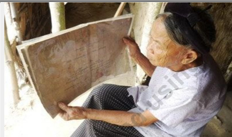
Ước nguyện có gian nhà ngói thờ con liệt sĩ sợ không kịp khi sức khỏe của mẹ đang yếu dần từng ngày.

Trước việc người nhà ông Đôi kéo người đến can thiệp, không cho máy múc, san ủi đất, chính quyền xã Thạch Lâm thì không dám đứng ra giải quyết, nên gia đình mẹ liệt sĩ đành phải ngậm ngùi trả tiền xăng dầu cho chủ máy xúc đánh máy đến mà không được làm việc.