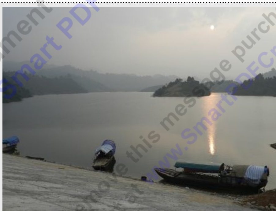
Đập Đá Hàn, nơi xảy ra vụ va chạm thuyền.

Hành lý mà 5 người mang theo là 4 ba lô có máy cưa và 1 số đồ đạc có giá trị khác để đi khai thác trầm, phát rẫy trồng keo non. Khi sang bờ bên kia đập, cả nhóm để lại 4 ba lô trên bờ đi đánh cá dưới hồ.