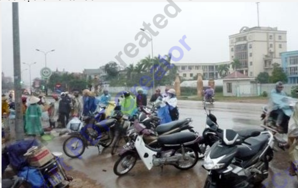
Đối diện với khu đất vàng hàng chục nghìn m 2 bỏ hoang là cảnh tiểu thương và người dân phường Đại Nài tràn ra QL1A buôn bán vì chợ quá chật hẹp

Có ý kiến cho rằng, đối chiếu với Luật đầu tư thì đáng ra dự án Nhà máy bia Toàn Cầu đã bị thu hồi từ lâu.