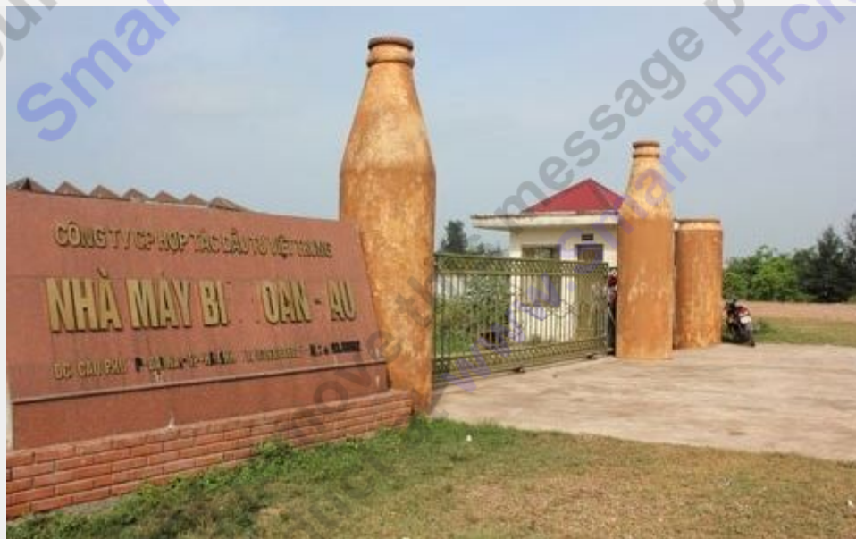
Một lãnh đạo TP. Hà Tĩnh nói rằng, do thời kỳ đó tình “khát đầu tư” nên đã đưa nhà máy vào thành phố mà không tính chuyện tác hại của nó!

Sau 2 tuần, UBND tỉnh đã ban hành văn bản đồng ý cho DN này thuê đất để xây dựng nhà máy bia 50 triệu lít/năm. Và giao cho Sở TN - MT kiểm tra việc thu hồi đất.