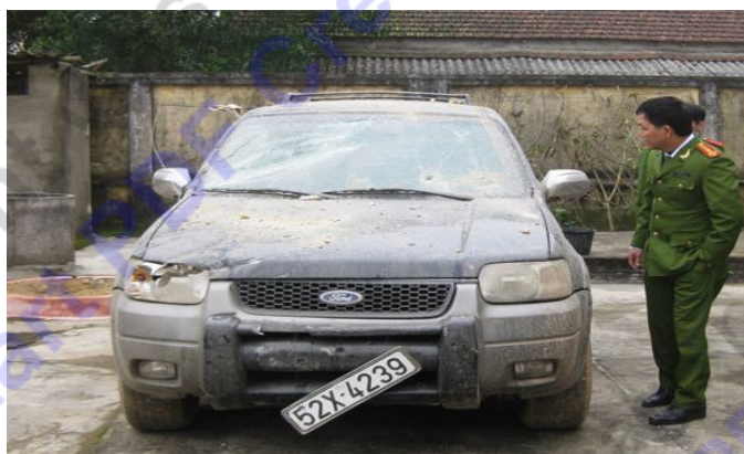
Chiếc ô tô của Hùng bị đập phá hư hỏng nặng

Nhận tin báo, Công an H.Can Lộc cùng chính quyền địa phương đã nhanh chóng có mặt tại hiện trường, thu thập chứng cứ để điều tra làm rõ nguyên nhân vụ việc.