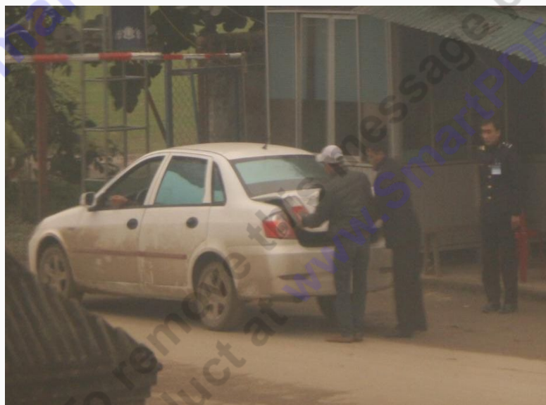
Xe máy, xe du lịch cũng bị mở ra kiểm tra

Khu kinh tế Cửa khẩu Cầu Treo là khu vực dân sự, nằm cách cửa khẩu Cầu Treo khoảng 40km về phía Đông, nơi tập trung dân cư buôn bán và sinh sống đông đúc. Việc hải quan tăng cường vào khu vực này để kiểm tra, đã cản trở lớn đến việc sinh hoạt thường ngày của người dân địa phương.