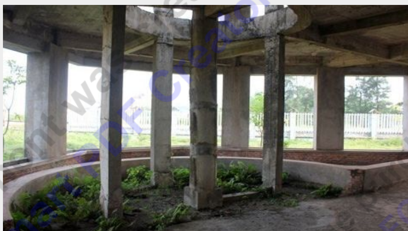
Một số hạng mục đã được xây dựng phần thô...