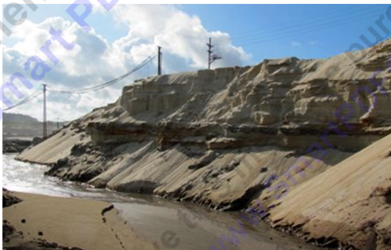
Mỏ sắt Thạch Khê đã tạm dừng bóc đất tầng phủ

Tuy nhiên, nguồn tin mà Dân trí có được, hiện UBND tỉnh Hà Tĩnh vẫn chưa đồng ý trước đề xuất nói trên của VINACOMIN. Cũng như trước đó, quan điểm của UBND tỉnh Hà Tĩnh là TIC phải đóng góp đủ số vốn điều lệ 2.400 tỷ đồng như đã cam kết. UBND tỉnh Hà Tĩnh yêu cầu VINACOMIN với vai trò là cổ đông chi phối của TIC phải khẩn trương đốc thúc các cổ đông thành viên còn lại đóng góp đủ vốn; ưu tiên vốn cho những hạng mục hạ tầng tái định cư mang tính cấp thiết, vốn thanh toán nợ và hoàn thành các công trình tái định cư dở dang.