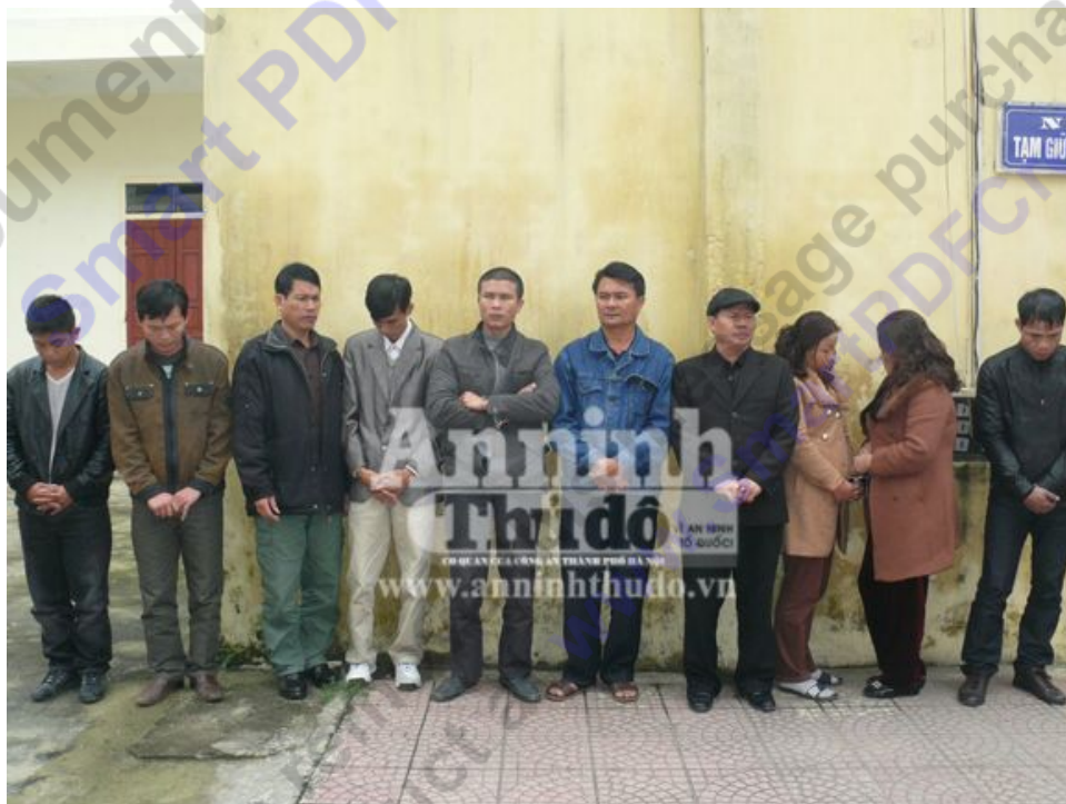
Các đối tượng tại cơ quan điều tra