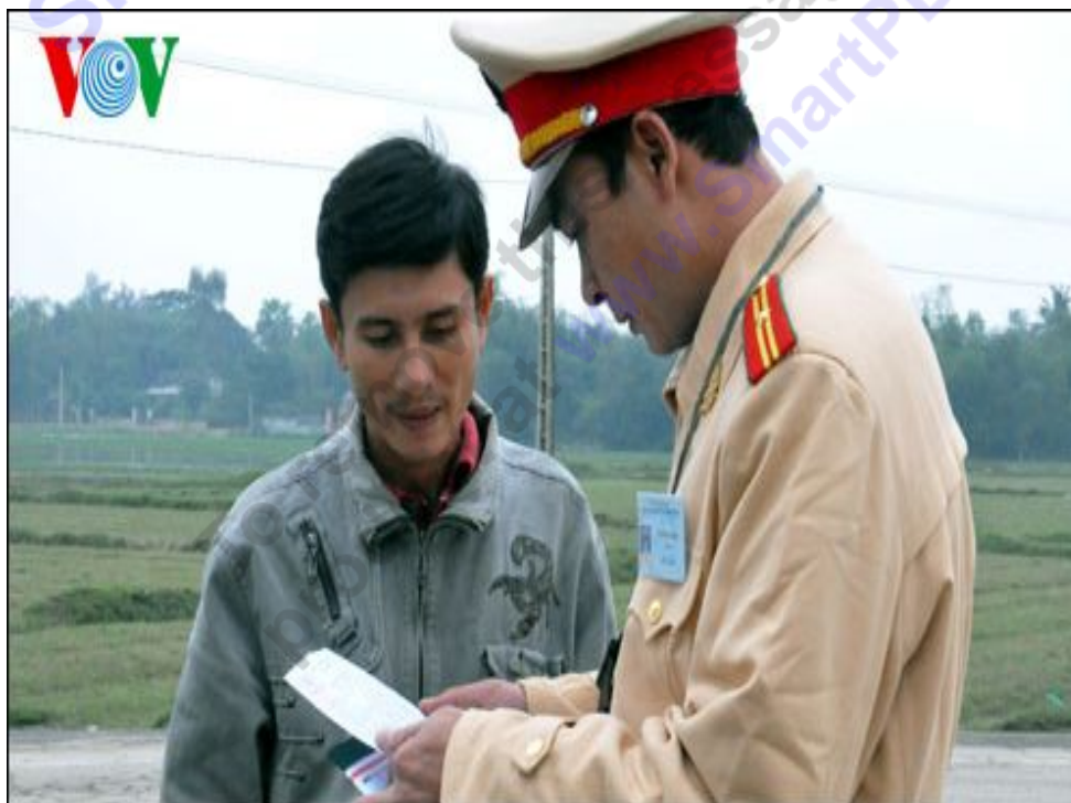
Cảnh sát giao thông kiểm tra phương tiện

Bởi vậy, ngày từ đầu năm, lực lượng cảnh sát giao thông đã tham mưu cho UBND tỉnh, ban Giám đốc Công an tỉnh một số giải pháp quan trọng.