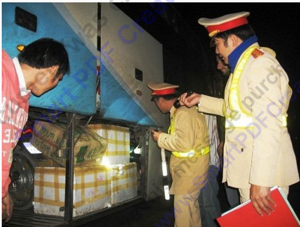
CSGT Hà Tĩnh phát hiện nhiều vụ vận chuyển hàng hóa trái phép.