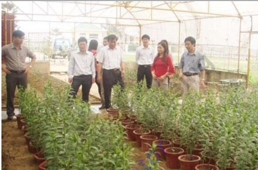
Từ độc canh trồng màu, người dân xã Thạch Môn, TP Hà Tĩnh đã có nguồn thu từ trồng hoa ly

Ngoài phát triển nghề trồng hoa, sản xuất, ươm trồng cây cảnh cũng phát triển rất mạnh, trở thành một điểm nhấn thực sự cho bước đột phá về phong trào trồng hoa, kinh doanh sinh vật cảnh, cũng như sự đa dạng hóa nông thôn, nông nghiệp của tỉnh này. Từ thành thị đến nông thôn ở Hà Tĩnh, không khó để tìm ra những gia đình, những cơ sở, doanh nghiệp sở hữu những vườn cây cảnh, đặc biệt là cây cảnh thế được cắt tỉa công phu, có đầu tư với trị giá mỗi cây lên đến hàng chục, thậm chí có cây lên đến hàng trăm triệu đồng. Riêng tại TP Hà Tĩnh, theo thống kê của Hội sinh vật cảnh thành phố, rất nhiều trong số gần 100 hội viên sở hữu, kinh doanh những vườn cây cảnh trị giá từ hàng trăm triệu đồng trở lên. Nhờ trồng hoa, sản xuất và làm dịch vụ sinh vật cảnh mà nhiều hộ dân thoát cảnh đói nghèo, nhiều gia đình phát triển thành doanh nghiệp có thu nhập hàng trăm triệu đồng/năm.