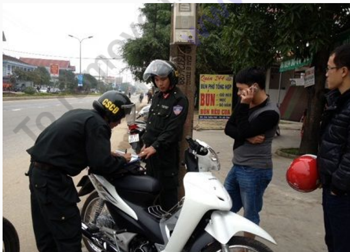
Các chiến sỹ phòng PC65 đang xử lý một vụ vi phạm giao thông.

Đặc biệt ngày 24/10/2012, qua công tác tuần tra kiểm soát, Đội Cảnh sát cơ động đã phát hiện và bắt quả tang một vụ đánh bạc lớn với hình thức xóc đĩa ở xã Thạch Hưng (TP. Hà Tĩnh). CQĐT đã bắt 23 đối tượng đang sát phạt nhau, thu giữ tang vật và số tiền lên đến gần 90 triệu đồng. Thành tích trên của đơn vị đã được Ban Giám đốc công an tỉnh biểu dương và khen thưởng.