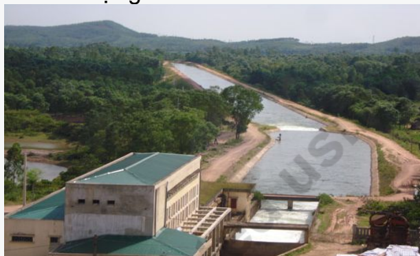
Hệ thống kênh dẫn nước của hồ

khoảng 90% khối lượng công việc xây dựng. Các kênh cấp 3 cũng đã hoàn thành khoảng 90% về khối lượng.