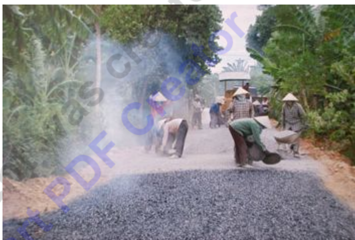
Nhân dân Thạch Văn nô nức mở đường

Xã Thạch Văn, huyện Thạch Hà là một điểm sáng trong công cuộc xây dựng nông thôn mới (NTM) ở Hà Tĩnh. Mặc dù huyện giao chỉ tiêu cho Thạch Văn về đích năm 2019, nhưng xã đã "xin được về đích trước 4 năm" tức là năm 2015.