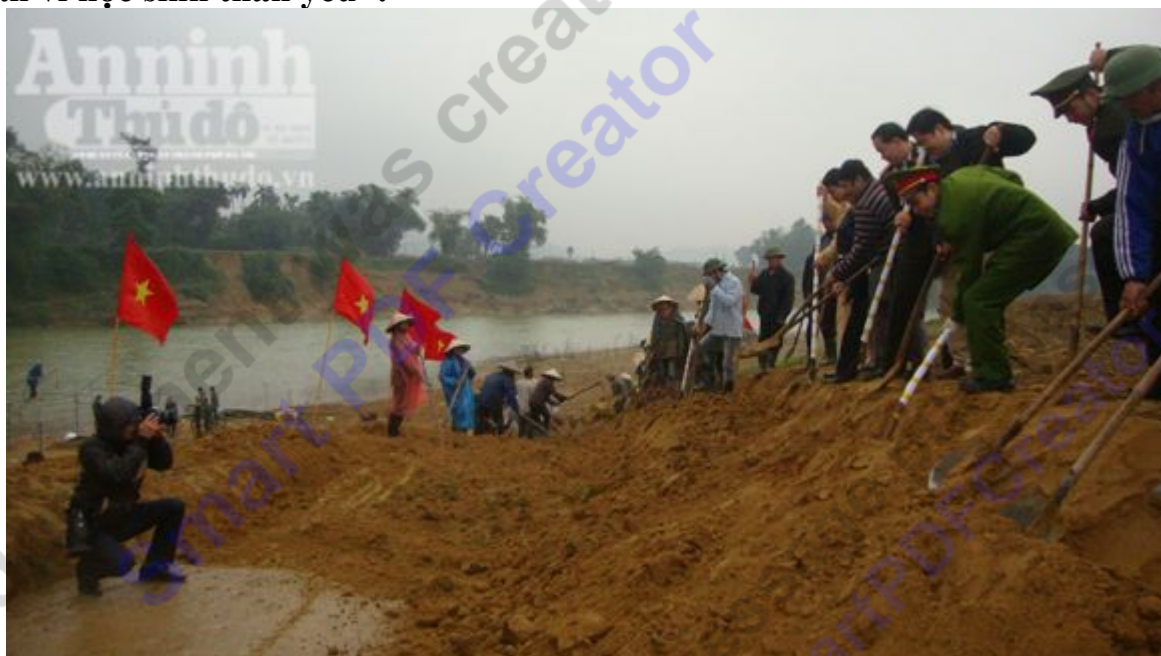
Các chiến sĩ công an cùng người dân tham gia làm đường dẫn ra bến đò

ANTĐ - Ngày 10-01, tại xã Hương Thủy (Hương Khê, Hà Tĩnh), Đoàn TN Tổng cục 5 - Bộ Công an, Đoàn TN Công an Hà Tĩnh cùng chính quyền địa phương với sự hỗ trợ của ngân hàng BIDV đã khởi công xây dựng "Bến đò an toàn vì học sinh thân yêu".