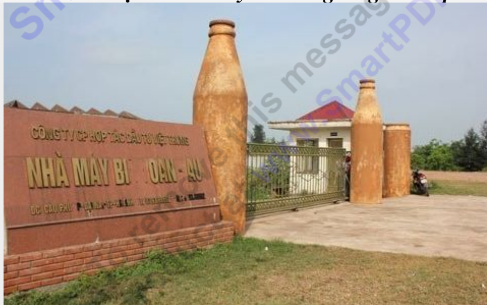
Hình tượng biểu trưng nhà máy bia Toàn Cầu hoen ố

Một số hình ảnh về Dự án nhà máy bia trong lòng thành phố chết yểu: