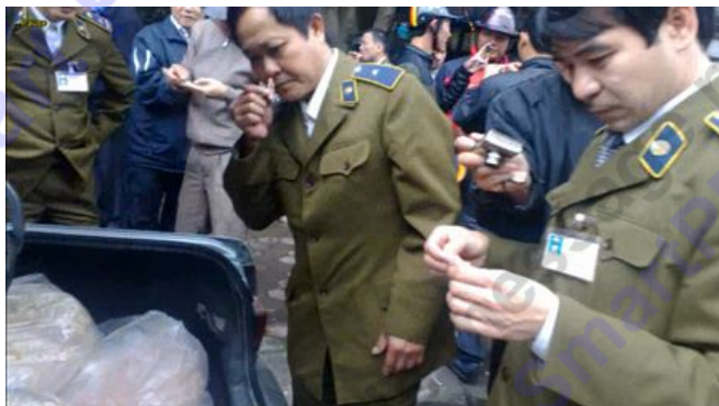
Lực lượng QLTT Hà Tĩnh kiểm tra, tịch thu toàn bộ lô hàng trên