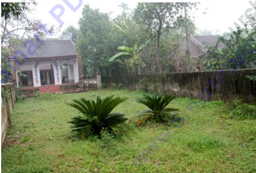
Khu đất tranh chấp giữa ông Võ Tá Dy và họ Võ chi thứ

Ngày 6/10/2012, Dân trí đã có bài “ Hài hước chuyện tòa soi kính lúp trên bản đồ để... đo đất ” phản ánh vụ kiện tranh chấp đất giữa ông Võ Tá Dy (có GCNQSD đất) và một bên là họ Võ chi thứ (không có GCNQSD đất). Tòa án nhân dân huyện Đức Thọ đã “đo đất” bằng cách... soi kính lúp trên bản đồ rồi xử thắng kiện cho bên không có sổ đỏ.