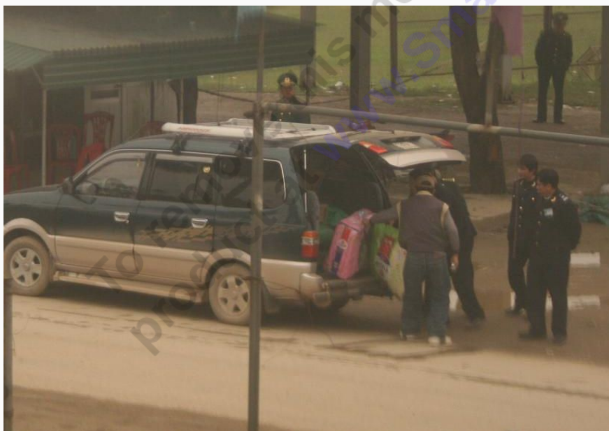
Sự kiểm tra thủ công, gây phiền toái cho người đi đường

Khu kinh tế cửa khẩu quốc tế Cầu Treo là khu vực có ranh giới địa lý xác định thuộc lãnh thổ và chủ quyền quốc gia nhưng có không gian kinh tế - thương mại riêng biệt, bao gồm: thị trấn Tây Sơn và các xã: Sơn Kim 1, Sơn Kim 2 và Sơn Tây thuộc huyện Hương Sơn, tỉnh Hà Tĩnh. Điều này được hiểu, những hoạt động thương mại trong khu vực này được miễn thuế quan.