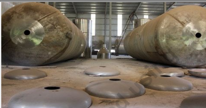
Một số khác thì nằm chất đống trong kho, bụi phủ mờ.