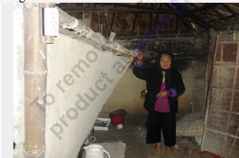
Lều tranh dột nát, vách đất xiêu vẹo nơi mẹ liệt sĩ sống hàng ngày

Và một điều thay đổi dễ nhận biết nhất là bên trong túp lều tranh của mẹ đã dột nát nhiều hơn sau một mùa mưa, gió. Bốn bức vách đất đã xiêu vẹo, ngả nghiêng.