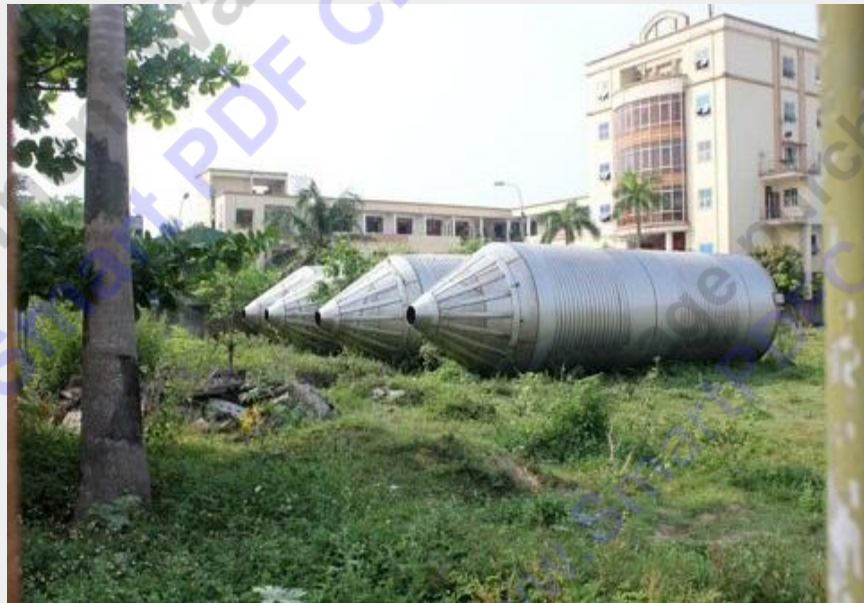
Một số thiết bị chưa kịp lắp đặt nằm phơi nắng mưa trong nhiều năm.