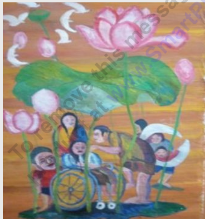
Một tác phẩm của Lĩnh

Với Lĩnh, có lẽ thành công đến với anh là thành quả đền đáp cho một quá trình nỗ lực và phấn đấu không biết mệt mỏi. Ban đầu anh cứ vẽ và vẽ cho quên đời, vẽ để xua đi những ám ảnh về sự bất công của số phận.