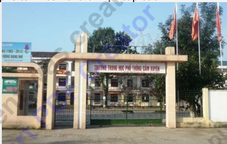
Trường THPT Cẩm Xuyên, nơi có học sinh tham gia đánh nhau